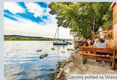
Čarovný pohľad na Sĺňavu

Letná terasa s výhľadom na hladinu jazera a panorámu Považského Inovca sa nachádza pri Lodenici v Piešťanoch, priamo na cyklotrase okolo Sĺňavy. Zákazníci sa radi zastavia na ze-