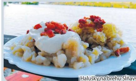
Halušky na brehu Sĺňavy

miakovú placku, bryndzové halušky či čapované nápoje, ktorých je tu široký výber, či len tak na terase pokochať sa a inšpirovať prírodou. U Dina sa žije v symbióze s prírodou – bez plastových obalov a odpadkov v okolí.